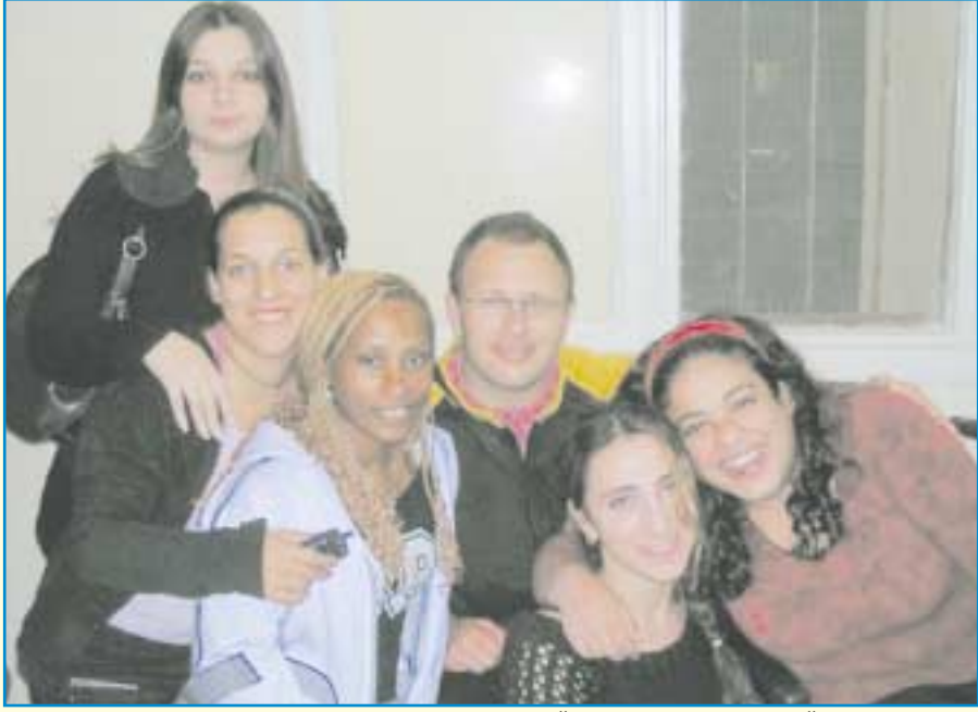
חברי המכינה, "מרגישים כמו משפחה"

כשמעתי על התוכנית בפעם הראשון שתי לעזוב את הבית ולהתנתק מהחב"סכיבה הטבעית. אבל אחרי שמכירים ר"ה, מרגישים כמו משפחה, אפילו שק"ת". : "בהתחלה חשבתי שאני אצטרך יותר אשר אתרום. ההחלטה להצטרף עוררה טובה, מהולה בפור. יש לי הרגשה שא"ת".