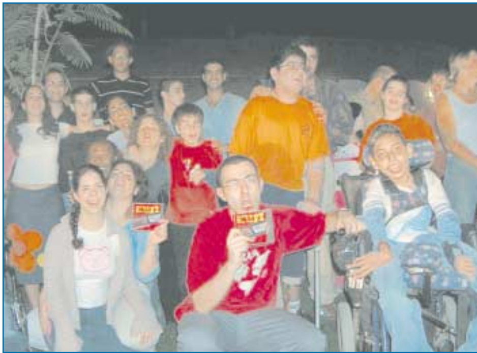
החניכים, המדריכים וההורים מתגאים בדיסק החדש

בערב הורים בסניף נגב חגגו החניכים ומשפחותיהם בשירים וריקודים. בסוף גם היתה הפתעה