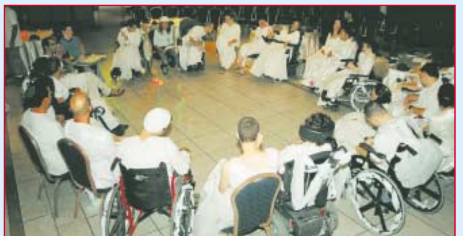
תיאטרון ירושלים. הבוגרים מתכוננים להופעה