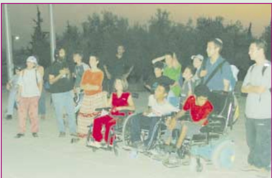
שומעים הסברים על הסיבה