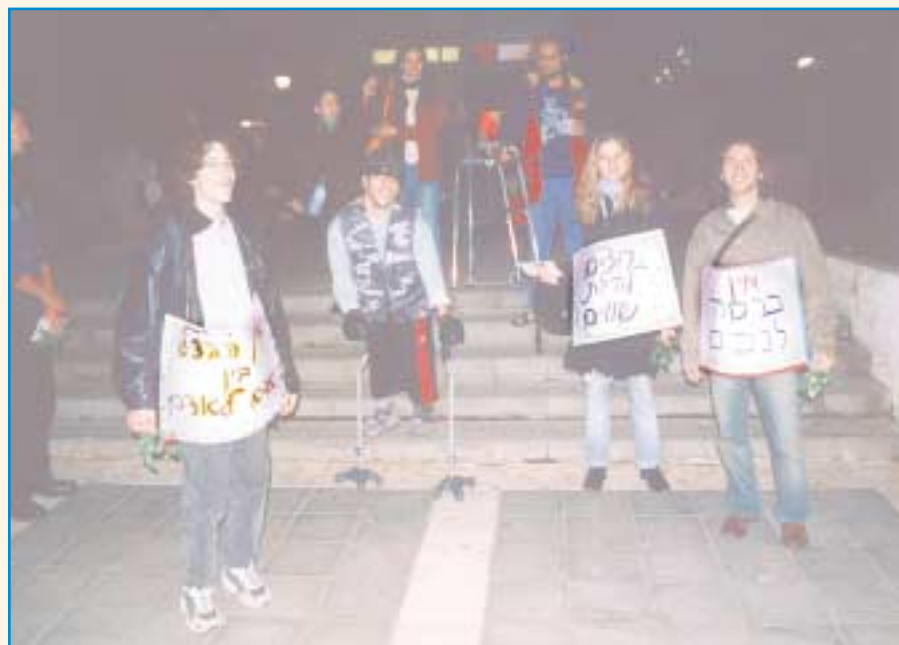
תהלוכת מחאה. אפילו כאן יש מדרגות

חברי חוג אמנות בהרצליה הציגו תערוכה בנושא נגישות. אירוע הפתיחה כלל גם הפגנה ברחובות תל אביב. "אל תשאירו אותנו בחוץ", קראו המשתתפים