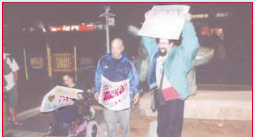
מפגינים בתל אביב. "נגישות לא באה ברגל"