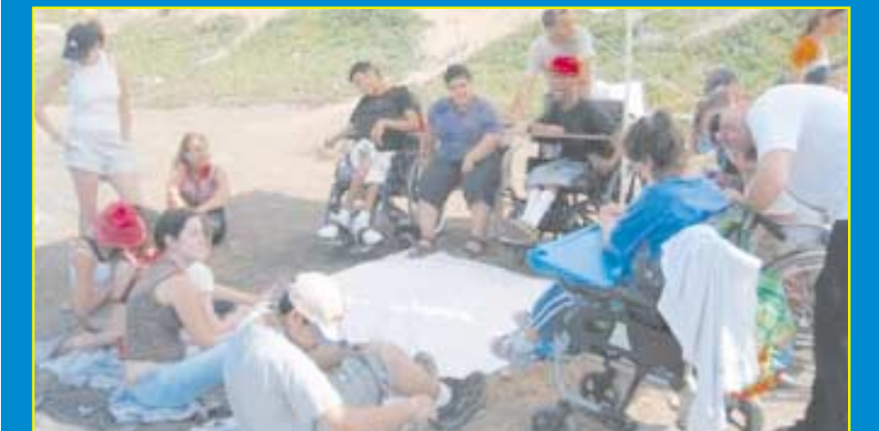
קבוצת "השועלים" ו"קשת" מהרצליה יצאו ליום כיף משותף. היה כיף!