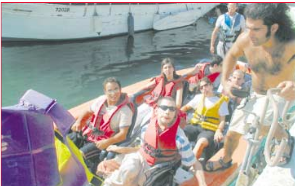
יוצאים לשיט. פעילויות מהבוקר עד הערב

בסדנת פיסול בבוץ בסחנה היינו אמורים לפסל