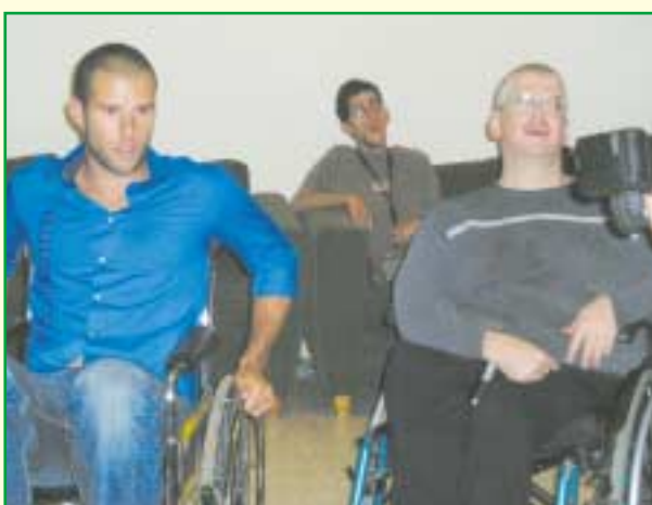
תמונה במחלוקת. שוורד עם עמית ומוטי (מאחור)

פתאום באמצע חוג עיתונות בהרצליה נכנס לבית הגלגלים יואב שוורד. למוי ששכה, מדובר בזוכה השע שועון "קחי אותי שרוץ", שהפך גם לדוגמן מפורסם. יואב הגיע לקראת הפגנה בנושא נגישות, שנערכה בתל אביב. המטרה היתה לעשות צילום לעיתונות, כדי לפרסם את ההפגנה. אני מבין שיואב הגיע מתוך כוונות טובות, כדי לעזור למטרה החשובה, אבל היה משהו מאוד פוגע במעמד. יואב החליט להצטלם כשהוא יושב על כיסא גלגלים, מתוך מחשבה שה