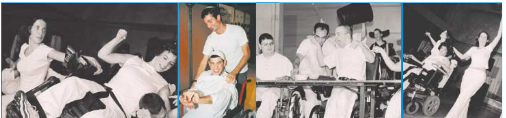
"אנחנו לא שחקנים, רקדנים, זמרים או נגנים, אבל יחד היינו לקבוצת תיאטרון". החברים על הבמה - ובהכנות שלפני

אין מילים לתאר את המופע עצמו, פשוט צריך לראות כדי להבין. כל אחד מהקבוצה ביטא את עצי