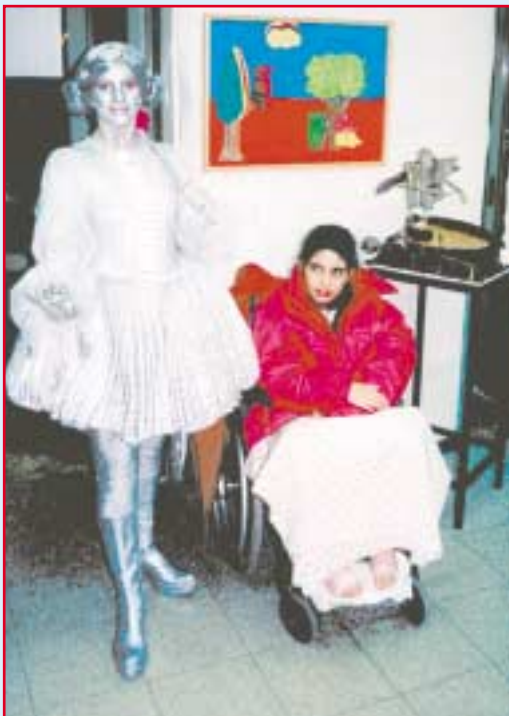
הפתיחה החגיגית של התערוכה