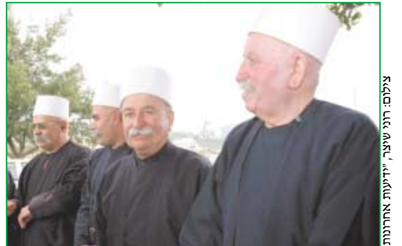
נכבדים מהעדה הדרוזית. עוזרים זה לזה בשעת מצוקה

מאת אמין "ידיעות בית הגלגלים" הדת הדרוזית הופיעה בימי הביי' ניים בין השנים 1017-1043 במדינת הפאטימיות במצרים. אבן אסמאעיל אל דרוזי הוא אחד מחמשת הנביאים הראשונים אשר הפיצו את הדת במצרים ובמזרח התי' כון. במצרים לא נותרו דרוזים עקב סכ' סוכים ורדיפות נגדם. בראשית המסור' רת הצטרפו כ-700,000 מאמינים, אך חלקם הגדול נהרג ברדיפות שנמשכו שבע שנים. מי ששרד נמלט להרים במזרח אגן הים התיכון. משם המשיכו הדרוזים להתפזר לאר' צות אמריקה הלטינית, בעיקר למדי' נות ברזיל, ונצואלה וארגנטינה, ומספ' רם מוערך כ-120,000. רוב המהגרים היו מלבנון וסוריה. בצפון אמריקה כ-70,000 דרוזים, רובם בארה"ב, וכ-60,000 במדינות שונות, בעיקר בחוף המערבי והמזרחי (ניו יורק, קלי' פורניה ולוס אנג'לס). בקנדה פזורים כ-20,000 דרוזים בערים המרכזיות. יש לציין שלפי המסורת הדרוזית ומ'