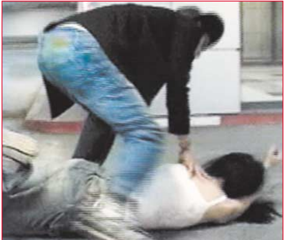
אלימות בסרט הסיום של תלמידי י"ב בתיכון בקרית אונו