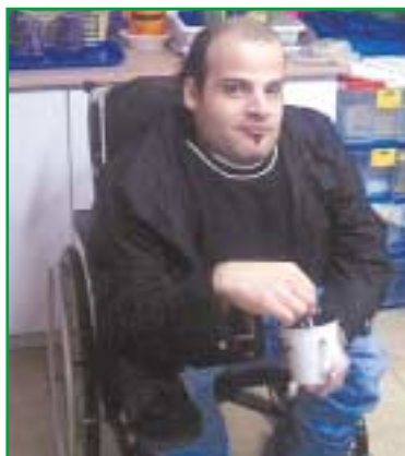
אמין. האדם הוא חומר ורוח

האדם שעבר עבירה על אחת ממצוות הדת ענש בהרחקה מהתכנסויות דתיות למשך תקופה מסוימת, שאור' כה נקבע על פי חומרת העבירה. שתי העבירות החמורות ביותר הן רצח וז' נות. בהתכנסויות הדתיות מושמעים דברי הטפה, מוסר, הדרכה דתית, קריאה בספרי הקודש ופירושם ושירים בעלי תוכן רוחני מיסטי. הדרוזי מתחתן עם אשה אחת בלבד, והיא חייבת להיות דרוזית. בני העדה מאמינים שהאשה היא מרכז החברה האנושית. תפקידה המסורתי: לדאוג לבית, לבעל ולילדים. אבל אשה דרוזית יכולה לבחור את בן זוגה, לגרש אותו, לרשת את הוריה ולכהן בתפקיד "כהן דת". הדרוזים נאמנים למדינה שהם נמי' צאים בה, כאשר מתייחסים אליהם כשווי זכויות.