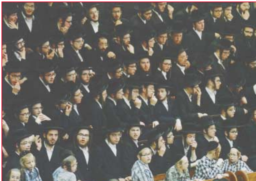
כנס חרדים. "הדת היהודית לפעמים מאוד קיצונית"

"ולא רק זה, בהרבה קיבוצים כבר אין בכלל חדר אוכל, וכל אחד אוכל בבית את הארוחה המופרטת שלו".