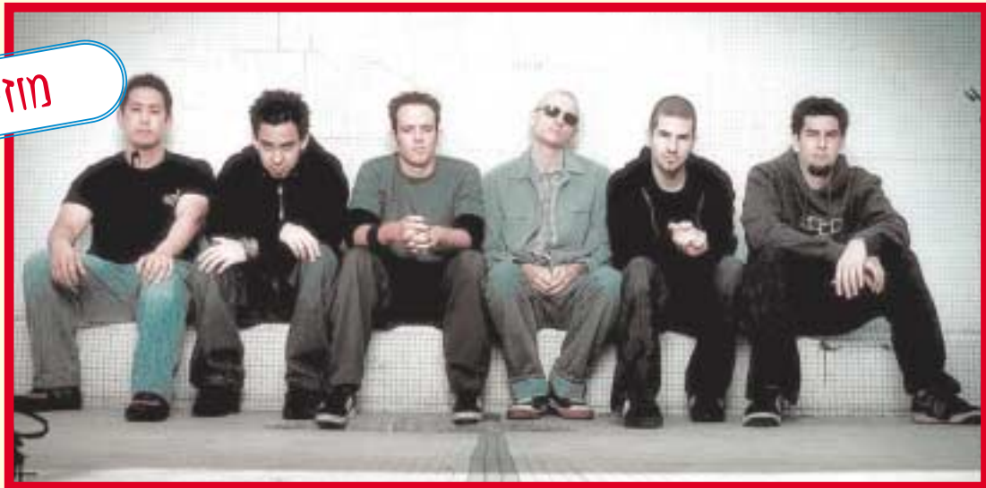
לינקין פארק. לפעמים חלומות נעורים מתגשמים